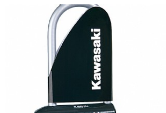
BLOCCO UNIVERSALE AD "U" € 82,60